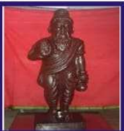
Duplicate Navapashanam Statue