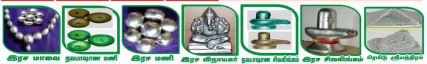
இரச மாலை நவபாஷாண மணி இரச மணி இரச விநாயகர் நவபாஷாண சிவலிங்கம் இரச சிவலிங்கம் பிரமிடு ஸ்ரீயந்திரம்