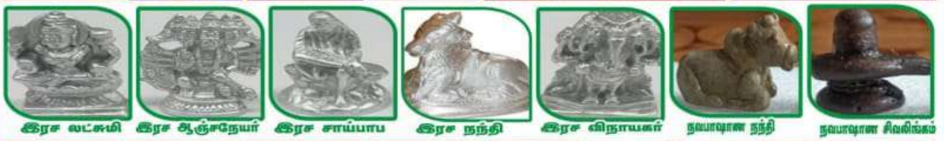
இரச லட்சுமி இரச சூட்சுநேயர் இரச சாய்பாப இரச நந்தி இரச விநாயகர் நவபாஷாண நந்தி நவபாஷாண சிவலிங்கம்