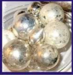
Duplicate Silver Lead Rasamani