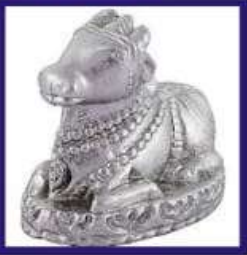
Duplicate Silver Lead Nandhi