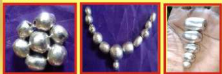
Herbal Rasamani Herbal Rasamani Malai Herbal Rasamani Kuligai

The energies of Navapashanam also greatly helps with productivity and motivation. It protects you from low energies and boosts your energies when you need to catch a break. The Navapashanam helps you to maintain great energies, the best way to take your career to the next level of success.