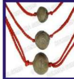
Duplicate Navapashanam Mani