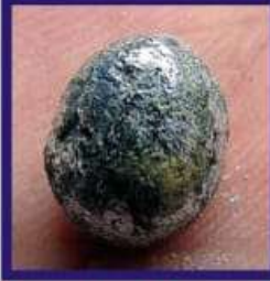
Duplicate Lead Rasamani