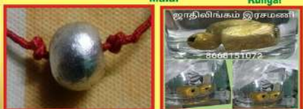
Herbal Rasamani Kuligai Herbal Rasamani Malai Kuligai