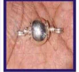
Duplicate Silver Lead Colour Rasamani