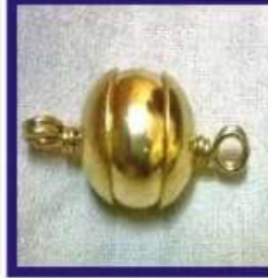
Duplicate Gold Silver Lead Colour Rasamani