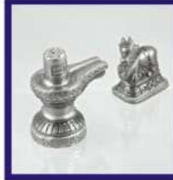
Duplicate Silver Lead Shivalingam