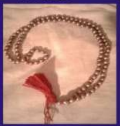
Duplicate Navapashanam Maalai