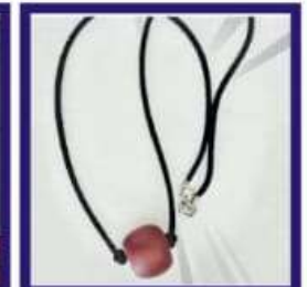
Duplicate Navapashanam Mani