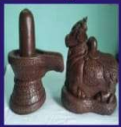
Duplicate Navapashanam hivalingam and Nandhi