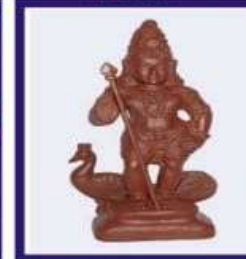
Duplicate Navapashanam God