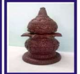
Duplicate Navapashanam Kalasam