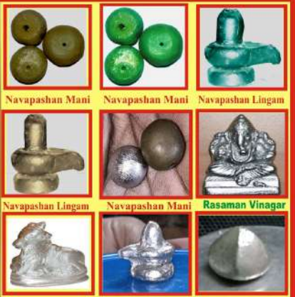
Navapashanam Mani Navapashanam Lingam Rasaman Vinagar Rasaman Nandhi Rasa shivaLingam Navapashanam Pyramid