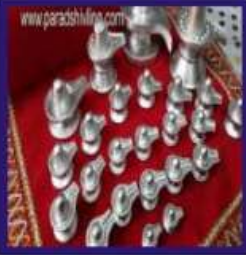
Duplicate Silver Lead Shivalingam