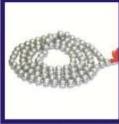
Duplicate Lead Rasamani Maalai