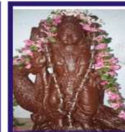
Duplicate Navapashanam God