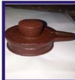
Duplicate Navapashanam Shivalingam