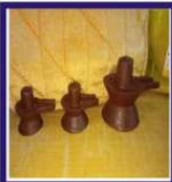
Duplicate Navapashanam Shivalingam