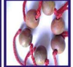
Duplicate Navapashanam Mani