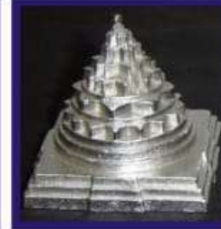
Duplicate Silver Lead Meru